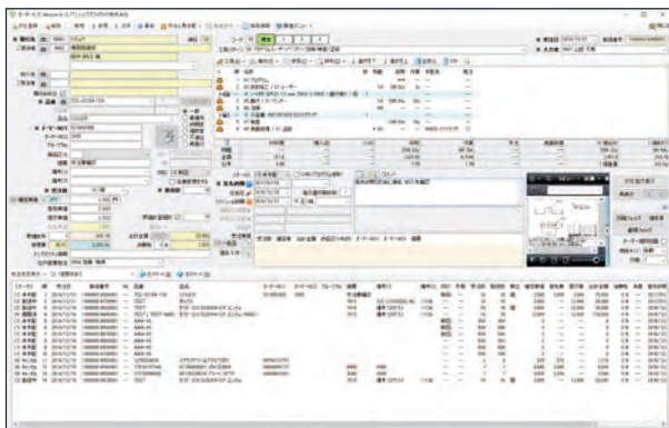
図①【CiPS FACTORY：オーダー入力画面】

Bravaは、これからもソリューションの付加価値の 向上をサポートしていきます。