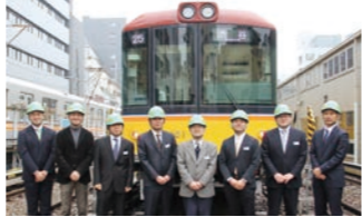
東京メトロ様(図面ビューア)

「SharePointだけでは、100万ファイルを保管する図面管理システムの要件は満たせませんでした。Bravaビューアを組み込むことで、検索やセキュリティ等の要件を満たすことができました」