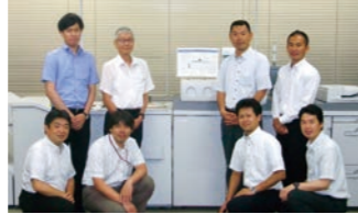
リコーインダストリー様(アノテーション)

「リコーインダストリーでは、Brava Desktopのマークアップ機能を利用して、16人/月かかっていた新製品の部品の規格書作成期間が1/8に短縮できました」