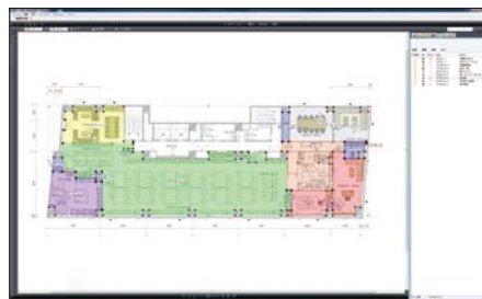
事務所平面図面(PDF)をBravaで閲覧：積算業務では、各フロアの部屋ごとに床・壁・天井等の面積を計測し、使用する部材毎に集計していく。